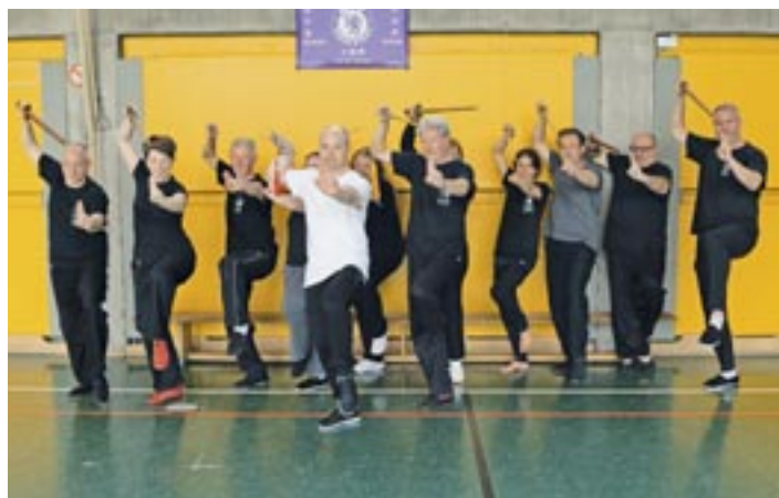
Schwertform im Tai Chi