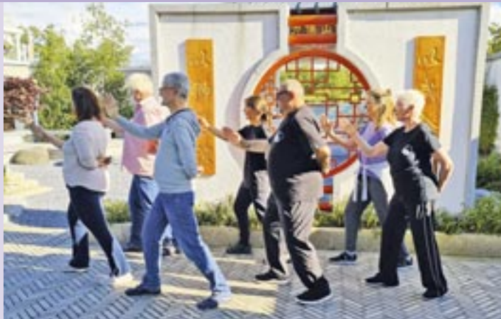
Tai Chi im „China-Pavillon“ des Piusparks