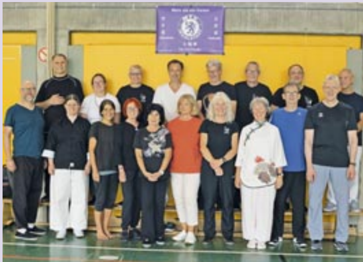
Eine Gruppe der Tai Chi Trainerfortbildung