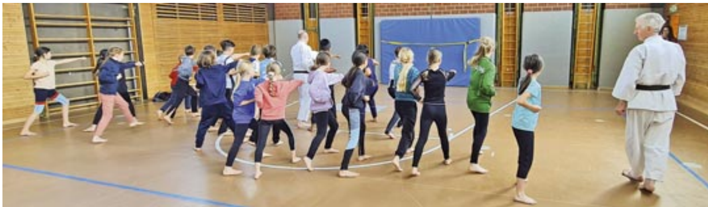
Schulklasse beim Karatetraining

schen Kampfkünste angesprochen: Respekt, Disziplin und Aufmerksamkeit. Als Dankeschön haben wir später noch von einer Grundschulklasse eine nette selbstgemalte Karte erhalten.