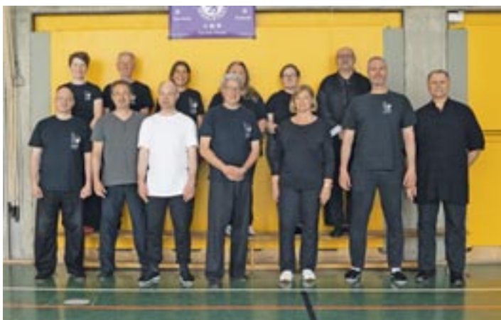
Teilnehmer des Tai Chi Lehrganges

„Hakutsuru“ und eine Tai Chi Schwertform intensiv geübt.